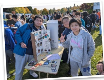
由学生会主办的返校节