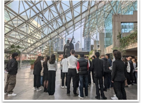
实地考察，实地考察，实地考察！突出的经历-农业部，UBC 植物园，罗杰的竞技场，法院